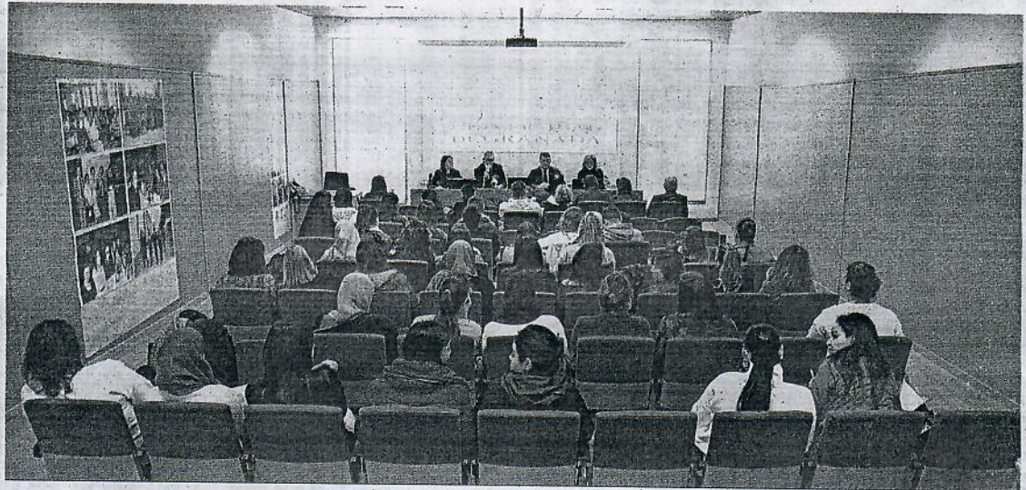
El público asistente forma parte del alumnado y licenciados de este grado.