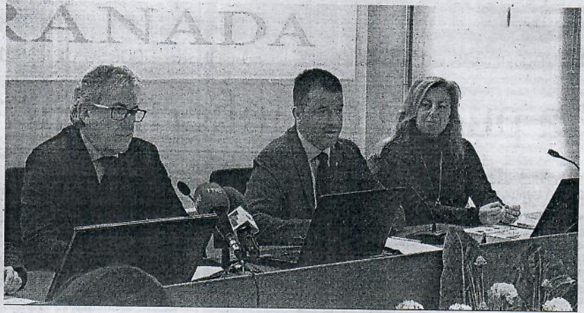
La inauguración tuvo lugar en el Salón de Grados del Campus.

● El campus universitario celebra las V Jornadas sobre ámbitos y perfiles profesionales del educador social