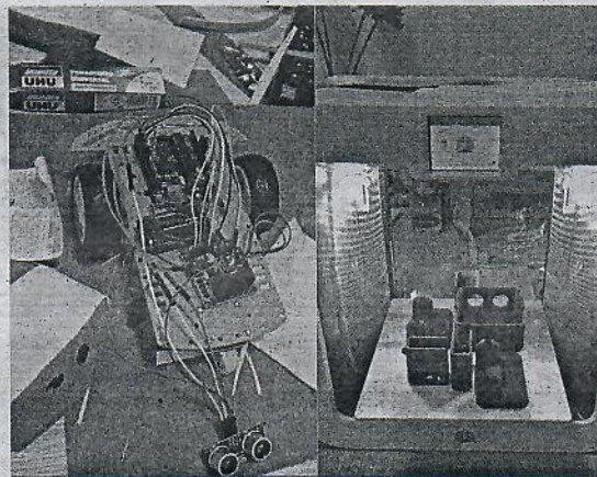
El coche 'esquivaobstáculos' (l) y las piezas del robot en una impresora 3D.

–Pensábamos que si las cogíamos de Bachillerato ya tienen las ideas más claras y saben dónde se van a dirigir en un futuro. Tercero y