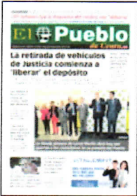
PORTADA DE HOY