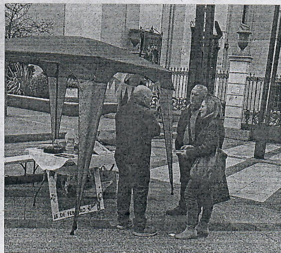
El stand de la asociación estuvo ubicado en la Plaza de los Reyes.

En otras ciudades de España se está realizando diferentes actos para dar mucha visibilidad a este síndrome.