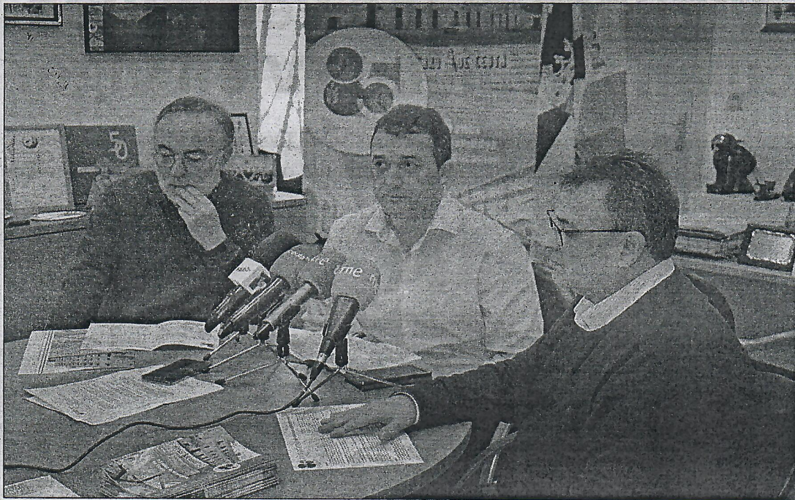
Fiel a sus orígenes durante esta conmemoración se hará hincapié a la relevancia de la figura del maestro dentro del tejido social.