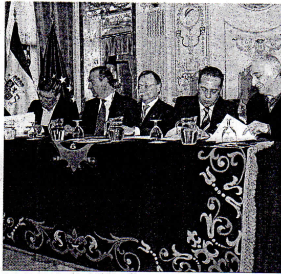
Firma de las bonificaciones con sindicatos y empresarios.

En este punto, la Delegación del Gobierno quiere transmitir un claro mensaje relativo a una de las verdaderas esencias de la medida