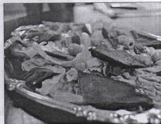
El producto, listo para comer.