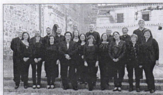
Coral polifónica de Granada.