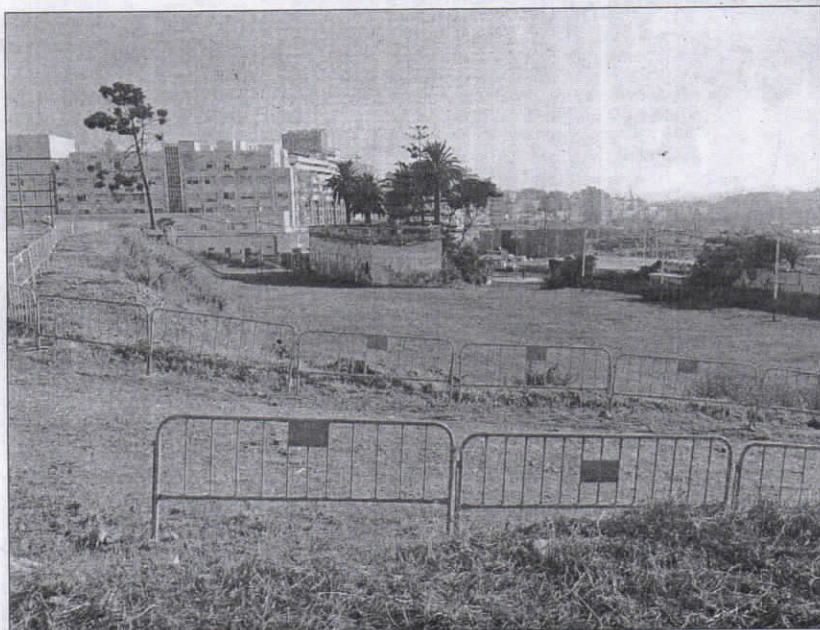
Zona en la que se ubicará el aparcamiento de la feria, ayer.

Además, Los Verdes considera que se trata de un "proyecto de futuro". Explican que, con la explanada de Juan XXIII, en la playa de El Chorrillo, a la cabeza, los salazones generan en Ceuta "unos 80 puestos de trabajo", pero que si se siguiesen estas indicaciones "se crearían unos 100 puestos de trabajo más, de manera directa o indirecta".