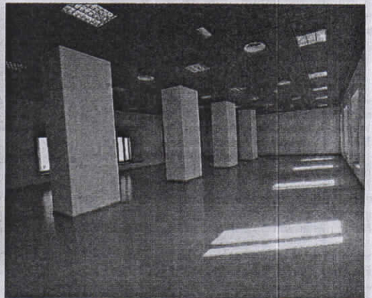
UGR y UNED esperan trabajar en nuevas titulaciones conjuntas.

"Lo importante es la colaboración entre las dos universidades y aumentar la oferta"