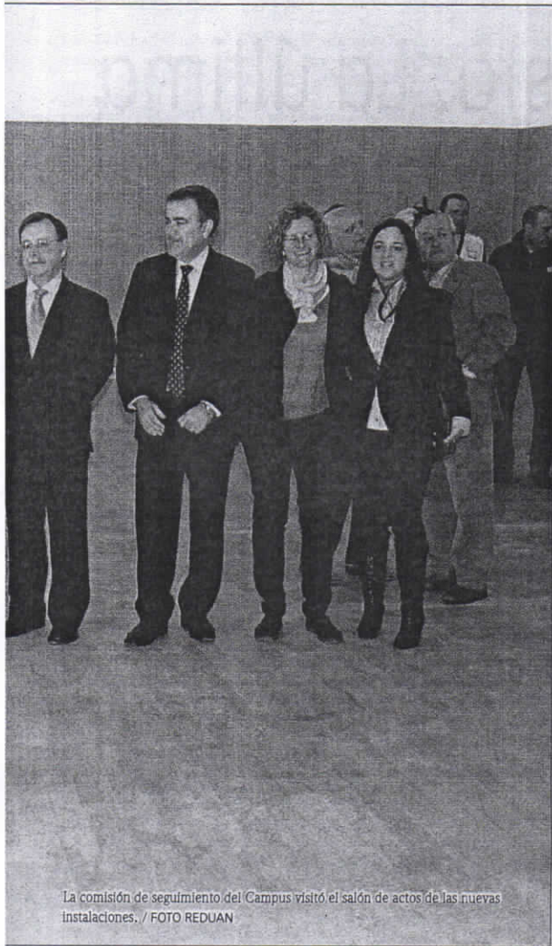
La comisión de seguimiento del Campus visitó el salón de actos de las nuevas instalaciones.