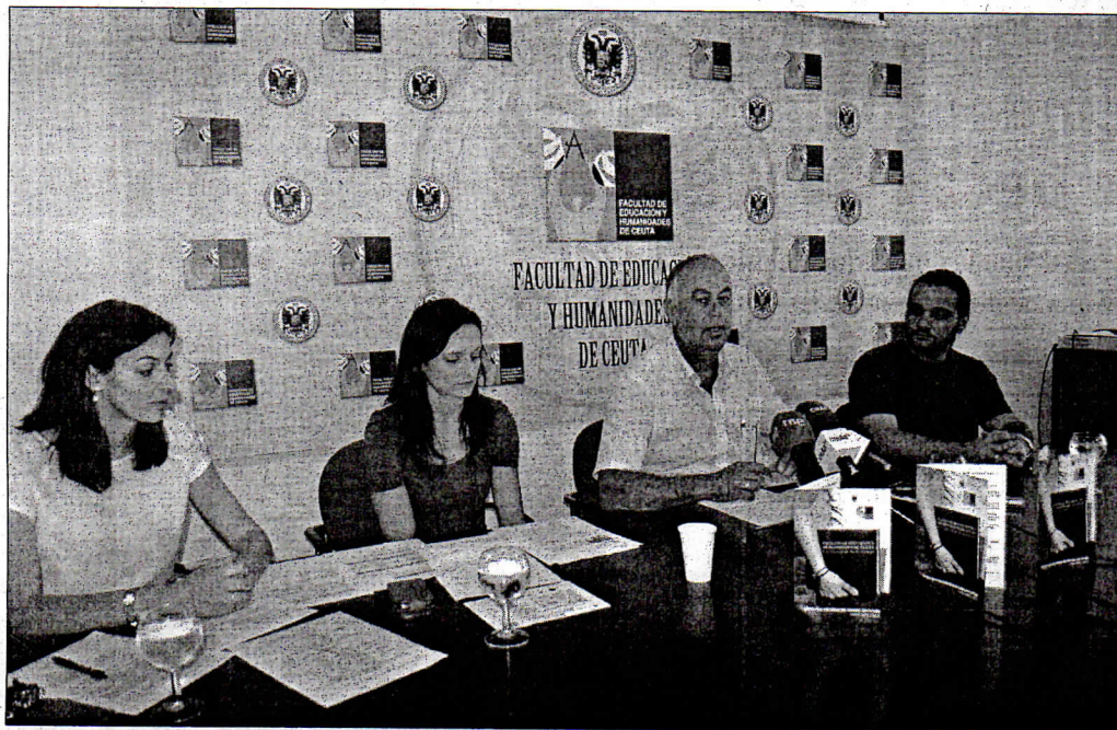
Los responsables de las áreas de magisterio, empresariales e ingeniería informática de la UGR presentan las titulaciones para el curso 2012-2013.