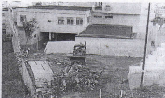
Estado del patio interior del CEIP Rosalía de Castro.

El Rosalía de Castro fue uno de los centros afectados por el fuerte viento de Poniente del pasado fin de semana, que también derribó dos depósitos de agua sobre el patio del colegio de las Adoratrices sin daños personales.