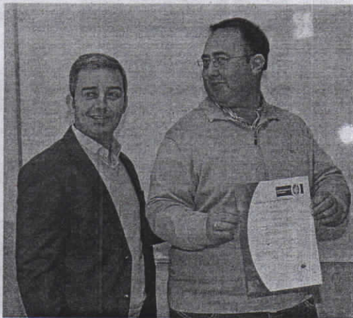
Uno de los alumnos recibiendo el diploma acreditativo.