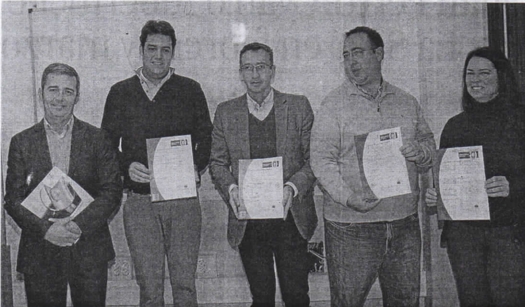
Los cuatro alumnos junto al gerente de la Academia Ecos que entregó los correspondientes diplomas acreditativos.