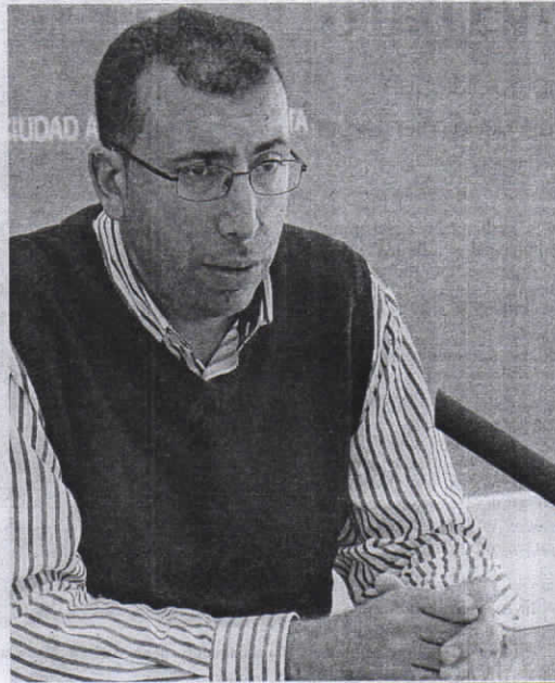
Ali cree que Carracao debería ser más "autocrítico".

● El líder de Caballas insiste en que el PSOE "se comporta como si que Ceuta sea CCAA dañaría la relación con Marruecos"