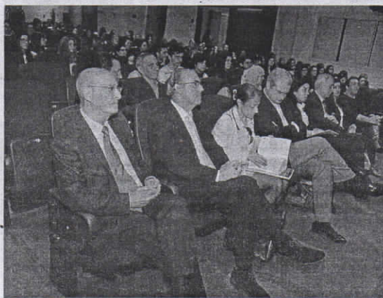
La mitad del público la componen alumnos de la UGR.