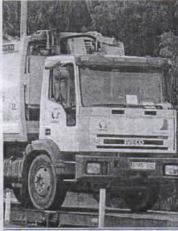
Los técnicos tienen 10 días para valorar.

En su escrito de alegaciones, a cuyo contenido ha tenido acceso este periódico, la empresa niega la mayor: "La Administración no ha aportado evidencia alguna de que las amortizaciones hayan dejado de producirse, conforme a la oferta y al Estudio Económico subya-