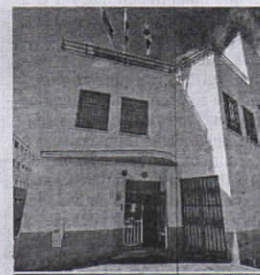
No hay Comisiones para 'foráneos'.

EDUCACIÓN. La Dirección Provincial del Ministerio de Educación y la Junta de Personal Docente revisó ayer las Comisiones de Servicios para el próximo año académico, que esta vez "no traerán a docentes con plaza en otras Autonomías". Según las fuentes consultadas sólo se ha aprobado una de este tipo para Secundaria.