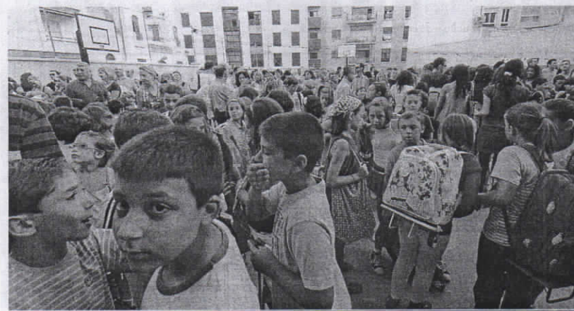
La ratio de alumnos por aula de 3 años se ha elevado para el próximo curso a 28 estudiantes en todos los centros.

realizará entre el 29 de este mes y el 16 de julio. El solicitante que no lo haga perderá su derecho. En septiembre se abrirá otro extraordinario para cubrir "al menos" el 20% del total de plazas ofertadas que se prolongará del 3 al 14.