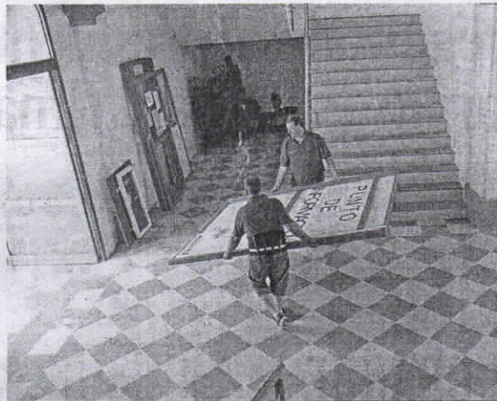
Los mozos descargan diversos objetos procedentes de Magisterio.

Los camiones de transporte trasladaron material y otros objetos hasta el Campus. Unas tareas que se prolongarán durante los próximos 20 días, estimó la vicedecana de Infraestructuras.