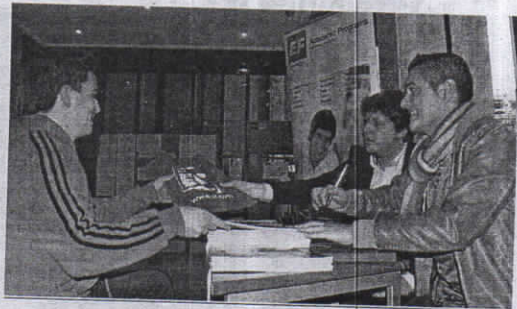
Los representantes de EF, con un joven interesado.

Los puestos de prácticas a cubrir con los currículums recogidos ayer en El Morro en la primera visita de esta naturaleza de EF a Ceuta están relacionados con las áreas de marketing y ventas, eventos y gestión de operaciones.