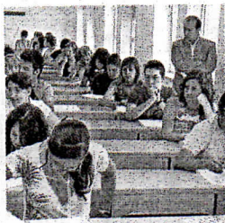
La citación, martes a las 7.30.

En la provincia de Granada son 5.057 los alumnos que harán lo mismo, mientras que el resto de los que la intentarán superar