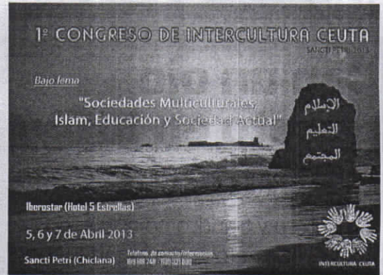
Cartel anunciador del congreso.

En varias lenguas. No todas las ponencias serán en español, ya que algunas se impartirán en árabe.