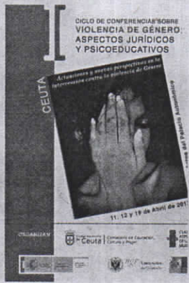
Serán tres días de charlas.

La matrícula, tal y como informaron desde la organización, es gratuita y los interesados pueden inscribirse mediante dos vías diferentes. Una, enviando un correo