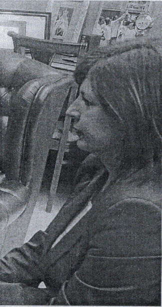
Acto de inauguración del curso.