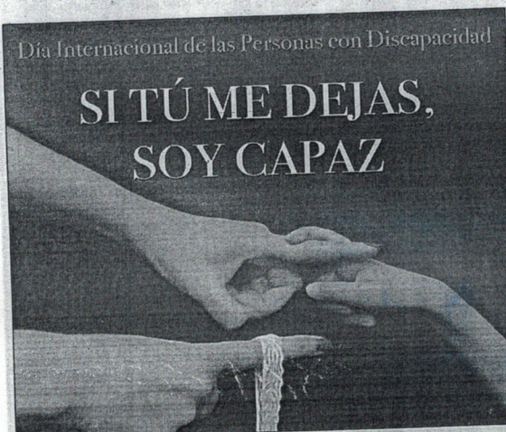
Campaña en torno a la inclusión por parte del Colegio San Antonio.