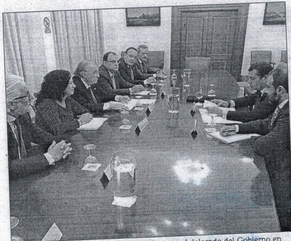
El Consejo de Graduados Sociales se reúne con el delegado del Gobierno en Andalucía.

1.500 investigadores de 13 instituciones científicas, coordinadas por la Fundación Descubre, quienes acercarán la ciencia a la sociedad en las ocho capitales andaluzas así como en Ceuta y Melilla, bajo el eslogan de "Mujeres y hombres que hacen ciencia para ti". Para ello, hay programadas más de 400 actividades, entre las que destacan talleres, microencuentros, exposiciones, experimentos, rutas guiadas o espectáculos científicos, con el principal objetivo de reducir la distancia entre la investigación científica y la ciudadanía subrayando la figura y la labor del investigador o investigadora en la sociedad.