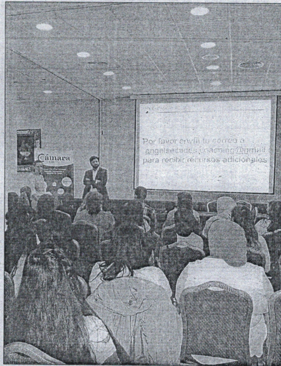
La Feria se celebró en el Hotel Ulises.

La Feria se prolongó durante toda el día clausurándose a las seis y media de la