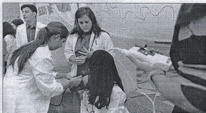
La primera edición de 'La noche europea de los Investigadores' en Ceuta.