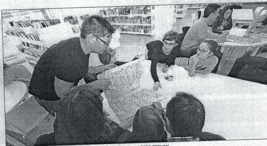
El taller de ayer por la mañana estuvo protagonizado por los niños.