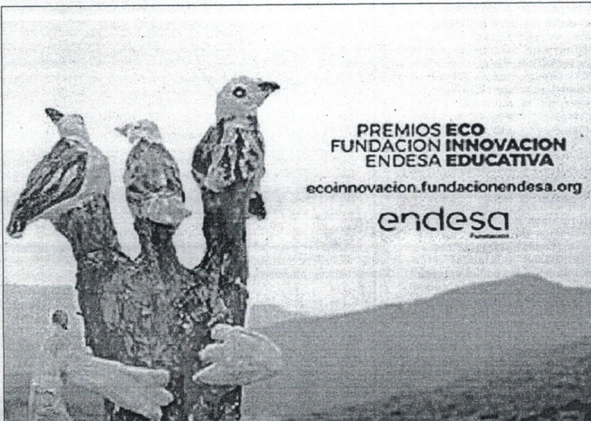
Convocatoria educativa en el plano del compromiso medioambiental realizada por Endesa.

Este año se quiere fomentar la participación de los cen-