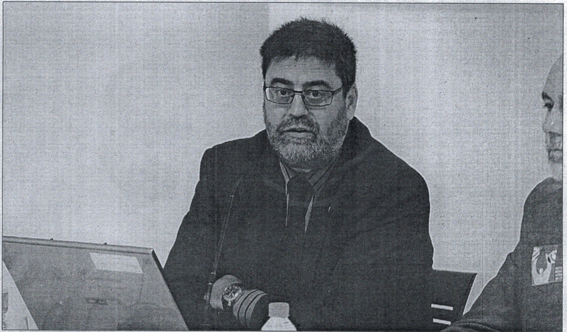
Antonio López, presidente de la Cámara de Cuentas de Andalucía y catedrático de la UGR.

El presidente de la Cámara de Cuentas de Andalucía alerta de que es necesario agilizar el tiempo de entrega de los informes sobre la gestión de fondos públicos