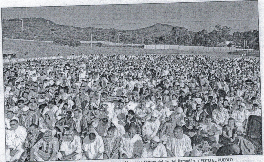
La propuesta formal de calendario escolar incluirá la incorporación como festivo del fin del Ramadán.

El órgano consultivo analizó otros asuntos como la necesidad de que el material escolar sea gratuito. También se abordó la importancia de mejorar el sistema de becas de Secundaria y futuros cambios en la convocatoria de septiembre.