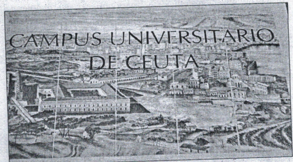
El BOCCE publicaba ayer dos resoluciones de la UGR.