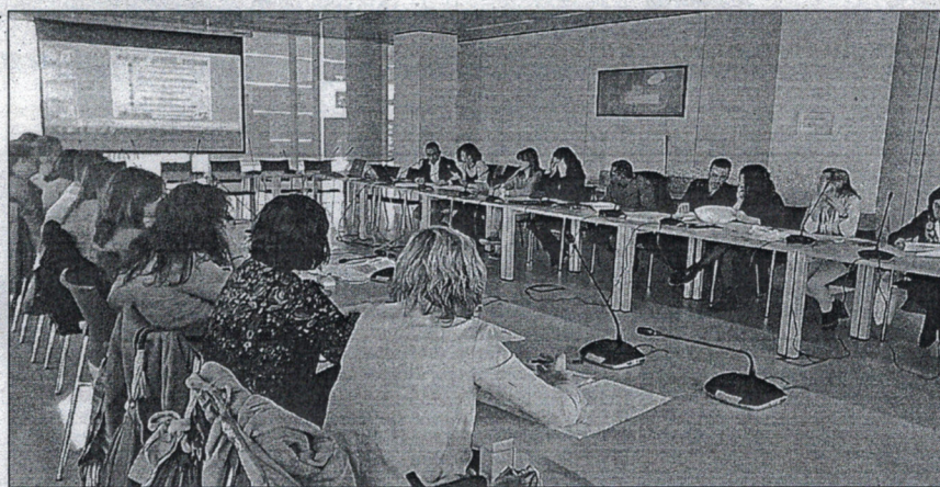
Reunión de la Comisión Técnica y el Grupo de Trabajo del Plan Estratégico de Convivencia Escolar.