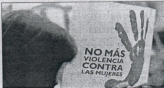
Se hará una performance en la Plaza de Los Reyes.

Centro Asesor de la Mujer. Más tarde, en la Plaza de los Reyes tendrá lugar la actuación en la que intervienen estudiantes del Grado en Educación Social e integrantes del CETI, organizada por Cruz Roja, la Facultad de Educación y CETI, y que ha sido integrada en el programa de actividades de Delegación del Gobierno.