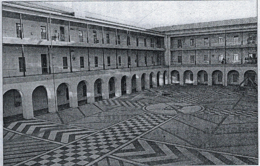
Los pasados 25 y 26 de febrero también se celebró una huelga.

Las redes sociales están siendo la vía para convocar a los estudiantes a secundar esta huelga para protestar contra la medida promovida por el Gobierno del PP. A esta lucha también se ha sumado la asociación ceutí Pedagogía Ciudadana que ayer, a través de su muro en las redes sociales, compartía el comunicado del Sindicato de