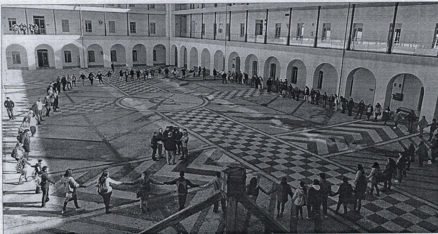
Sentada de los universitarios ante la falta de un gimnasio.