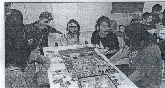
El Solitario celebra la II Edición de Juegos de Mesa del Terror.

Ahora comienza un nuevo curso y la expectación es máxima de cara a quién será La Voz de Ceuta durante este año.