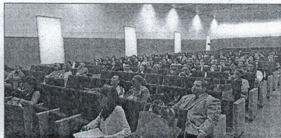
Asistentes a las Jornadas del Prácticum I y II.

Algunos centros que han colaborado en las Jornadas fueron el Lope de Vega, el Andrés Manjón, el Reina Sofía, el Maestro José Acosta, el Mare Nosttrum, el San Daniel y el Santa María Micaela, entre otros.