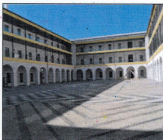
CAMPUS UNIVERSITARIO. EP.