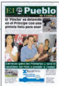
PORTADA DE HOY