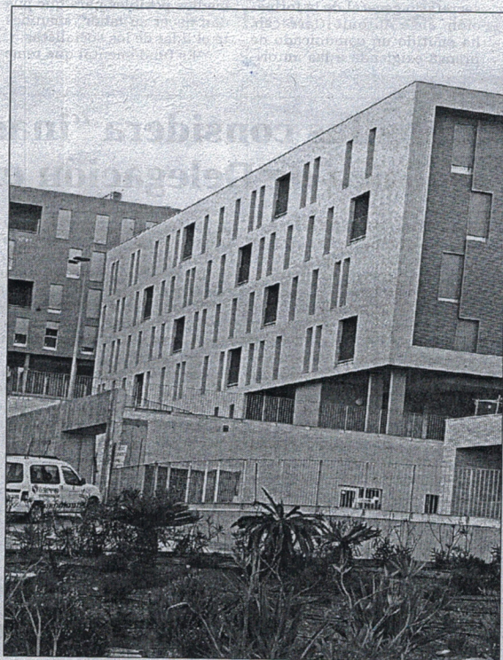
El Gobierno flexibiliza los criterios para la refinanciación de las VPO.

Inicialmente, la renta de la unidad familiar que podía acogerse a esta medida tenía como límite el IPREM (Indicador Público de Renta de Efectos Múltiples, el antiguo Salario Mínimo Interprofesional, actualmente establecido en 532,51 euros mensuales), pero ahora el límite será mayor, y se modifican tam-