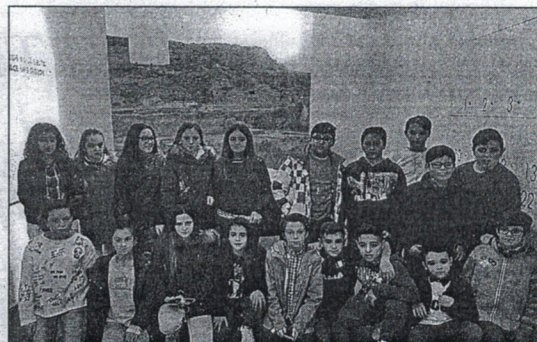
Los alumnos del 'Vicente Aleixandre' estarán hoy en el Campus.