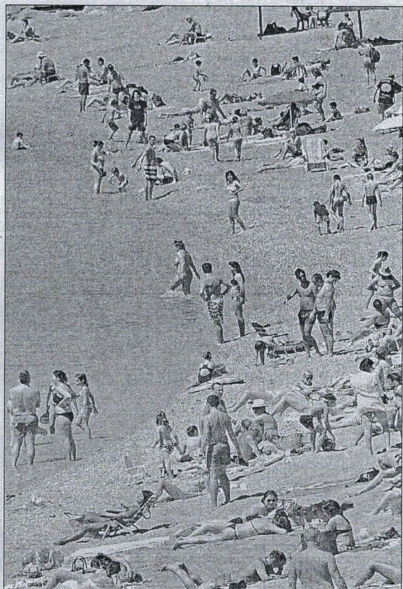
La crema se debe aplicar cada dos o tres horas, o tras cada baño.

Mientras, sobre los aceites, Vilchez alerta de que "sólo sirven para freír". "Si te lo pones en el cuerpo te vas a freír la piel, por lo que en principio están prohibidos ya que aumentan el daño el sol en nuestra piel", advierte este dermatólogo para explicar como un alto porcentaje de casos de cáncer de piel se curan e incluso, si se detectan a tiempo, no necesitan tratamientos como la quimioterapia.