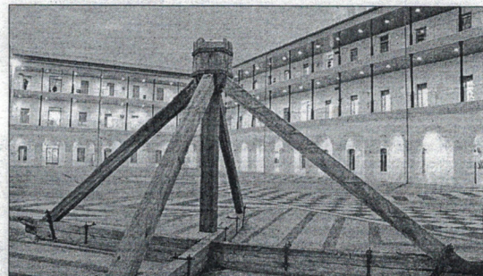
El BOCCE publicó ayer la resolución provisional de las ayudas.

También la Facultad de Educación, Economía y Tecnología ha tenido un periodo de reflexión y debate acerca de este asunto en el que, además, hay que tener en cuenta la convocatoria de Selectividad de septiembre que podría adelantarse con estas variaciones.