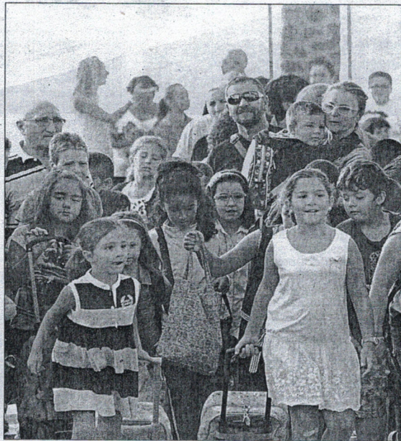
Búscome se preocupa por la infancia ceutí.

En este sentido Búscome se hace eco del "malestar surgido por la reducción de las becas de los comedores escolares y exige celeridad para que la Administración y los organismos pertinentes "subsanan estas carencias en la mayor brevedad posible y no existan menores que, aun teniendo ne-