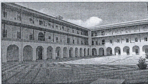
La primera jornada fue la de exámenes de asignaturas troncales

Según los datos facilitados por la Universidad de Granada, las solicitudes de matrícula recibidas en Ceuta han sido 333. Los alumnos que están realizando la PEBAU y la prueba de admisión son 281. Mientras, los que han optado sólo por la segunda alcanzan los 52. En todo la UGR, hay un total de 5.889 solicitudes de matrícula para esta prueba de evaluación.