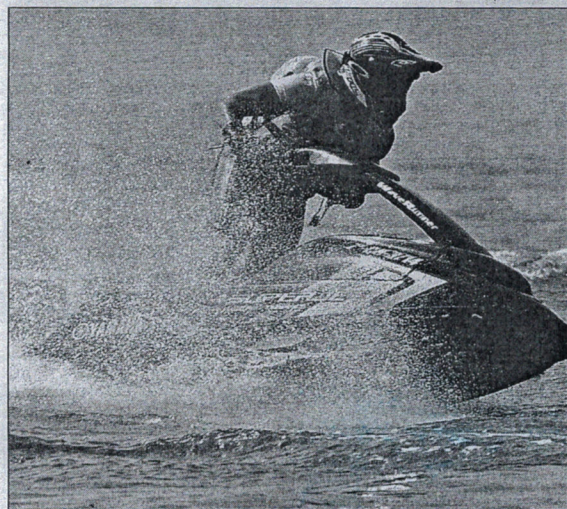
Las motos náuticas tendrán protagonismo mañana domingo.

Durante el primer año de vida de la Federación ceutí, se han federado más de 40 personas, lo que pone de manifiesto el interés que despierta esta actividad náutico-deportiva. Estas pruebas son puntuables y a los ganadores se les apoyará y subvencionará.