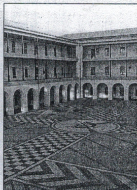
Campus Universitario.

Por último señalan que "La juventud debe saber la actitud de este Gobierno hacia sus jóvenes, por lo que difundiremos esta decisión por el propio Campus Universitario y plantearemos junto a las organizaciones estudiantiles, las medidas reivindicativas necesarias para decir ¡basta!, a una actitud, que empeora día tras día, la vida diaria de los/as jóvenes".