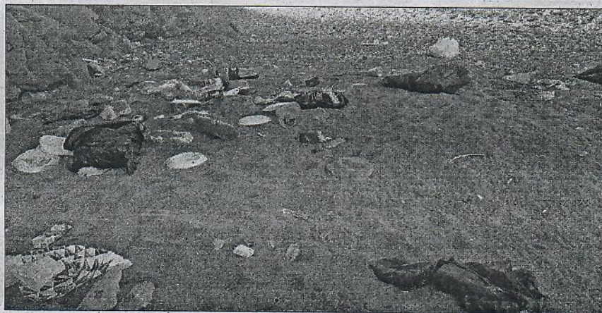
Imagen del estado de la playa del Cementerio.

Búscome dice que "es una lástima que teniendo esta ciudad un encanto natural emblemático, no se sepa por