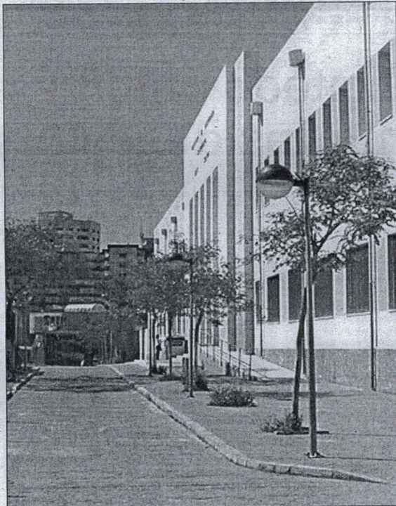
Fachada del IES Siete Colinas.