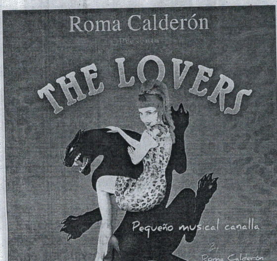
Cartel de 'The Lovers'.

pieza fundamental para el funcionamiento de la sociedad" y así lo señalan desde la facultad. "Una realidad que para los ojos de algunos resulta todavía invisible o pasa desapercibida y que los estudiantes universitarios de Ceuta han querido resaltar capturándola con sus cámaras y mostrándosela ahora al resto de la sociedad.