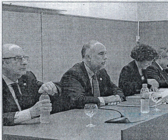
Acto de apertura del curso académico en el Campus Universitario.

2000, del 16 al 20 de noviembre, de Autocad civil 3D, en el segundo trimestre, cómo dar clase a los que no quieren, entre el 26 y el 28 de enero y también las Jornadas Educativas del Colegio de San Agustín, que tendrán lugar en marzo de 2016.