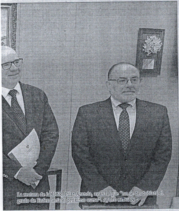
La rectora de la UGR, Pilar Aranda, avanza que "no se desdoblará el grado de Enfermería el próximo curso".