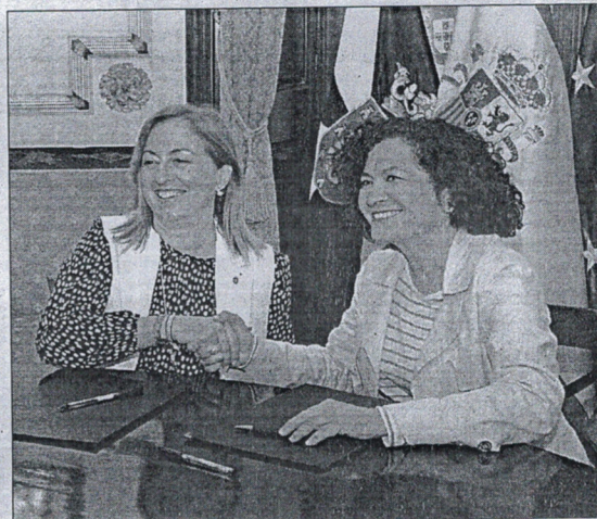
Servicios Sociales conviene con la UGR la formación de voluntariado para trabajar con población en exclusión.

Las líneas de actuación que la UGR trabajará al am-