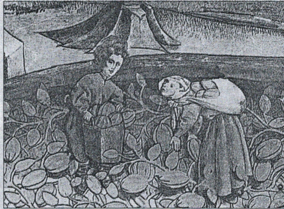
El Codex Granatensis es uno de los grandes códices que se conservan en España.

El códice cuenta también con un tratado de cetrería, probablemente de los siglos XII-XIII, y un Tacuinum Sanitatis incompleto, un manuscrito sobre sanidad y bienestar basado en el trabajo del médico árabe