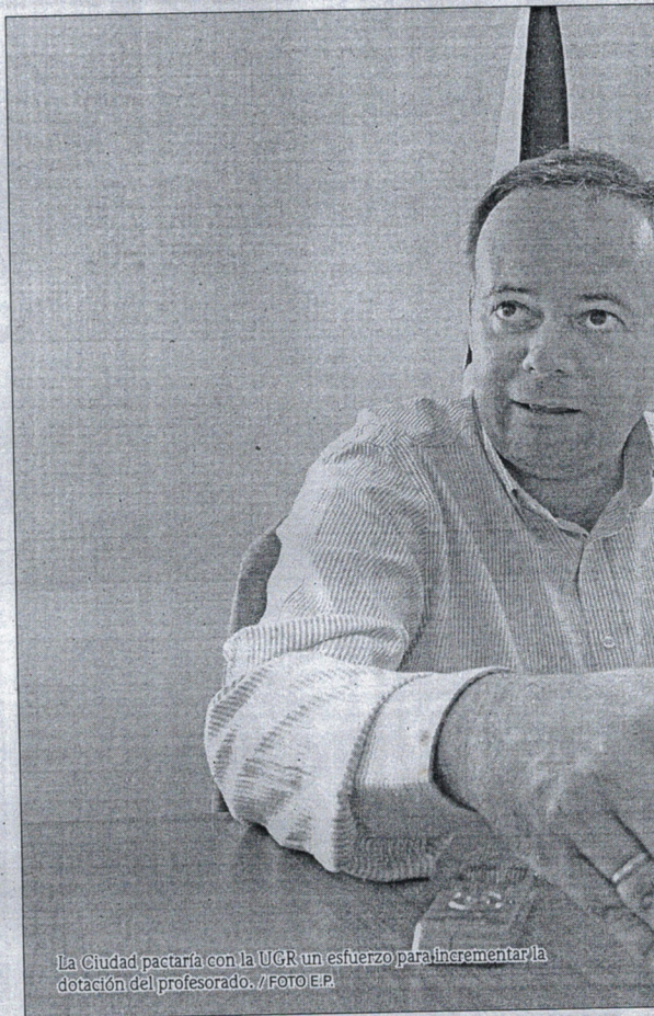
La Ciudad pactaría con la UGR un esfuerzo para incrementar la dotación del profesorado.

Además, el consejero de Educación y Cultura también recordó que ese profesorado, que lógicamente tiene una especialidad académica, posteriormente podría ser apto para dar clase en otras carreras afines, un hecho que podría servir también, además de para realizar dicho desdoblamiento, como "embrión para una futura expansión de la Facultad de Ciencias de la Salud, y pasar de ofrecer, única y exclusivamente el