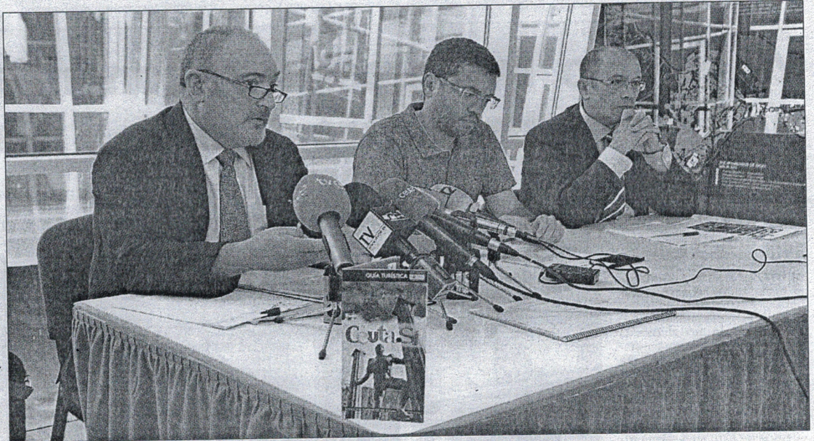
Los expertos de la UGR advierten del crecimiento de la clase media marroquí.